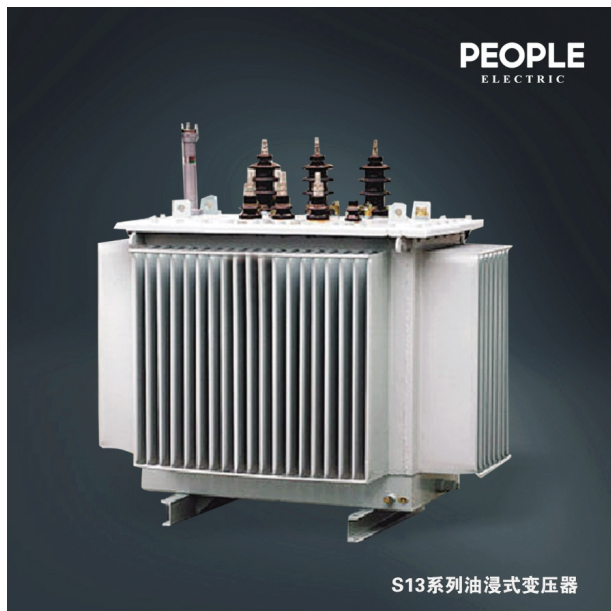
S13系列油浸式变压器

优良的产品美誉长传,江西变电设备公司不忘初心,持续为世界人民提供高质量和高技术含量的电力产品。