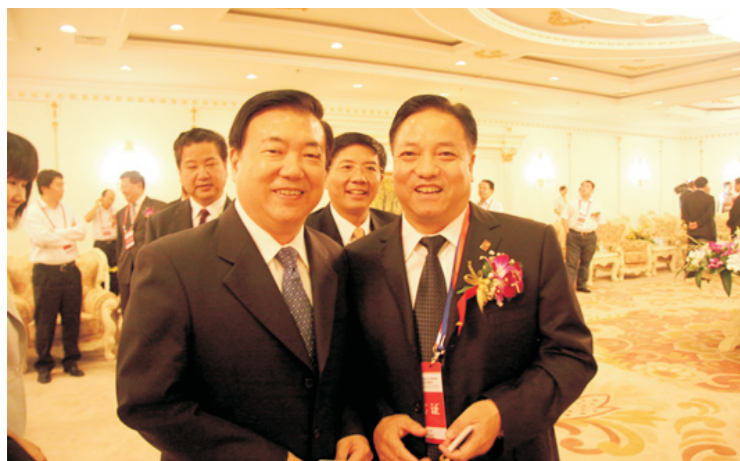
安徽省省长王三运与郑元豹在一起