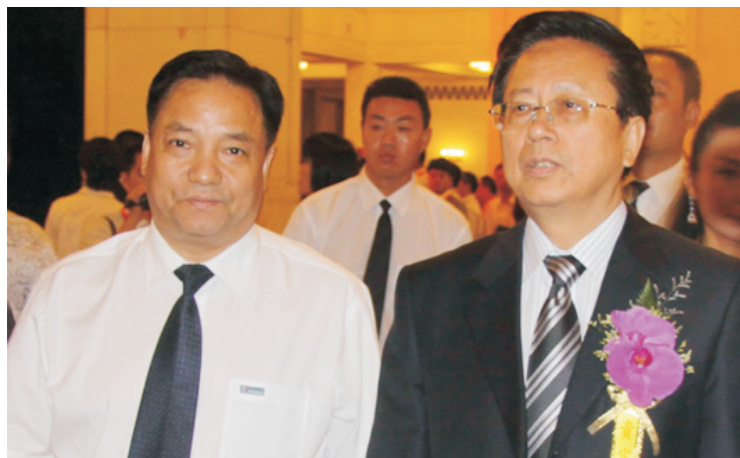
全国人大常委会副委员长陈昌智与郑元豹董事长交谈合影。

弘扬华商文化，展示华商风采。第六届杰出华商大会由世界杰出华商协会承办，根据公共影响力、财富创造力、企业领导力等评选出“2010中华商帮影响力人物”，在北京人民大会堂隆重发布。人民电器集团董事长郑元豹、盛大网络董事长兼首席执行官陈天桥等国内外著名企业家荣登金榜。