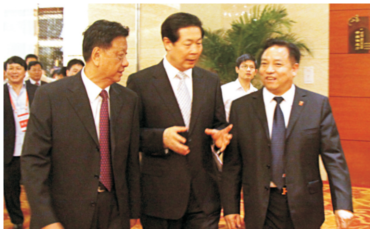
中企联会长王忠禹（左）、安徽省委书记张宝顺（中）、人民电器集团董事长郑元豹在一起

在“创新与企业竞争力互动论坛”上，郑元豹就企业愿景与使命、标准与体系、品牌与文化等问题作了精辟的论述。他说，中国企业最大的使命就是发展再发展，就业再就业，纳税再纳税，自觉维护党和政府的荣誉，遵守国家的法律法规，把社会效益摆在突出位置，为促进人类进步和经济发展做出贡献。